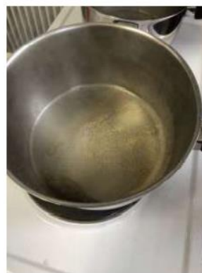
vaporisation de l'eau salée