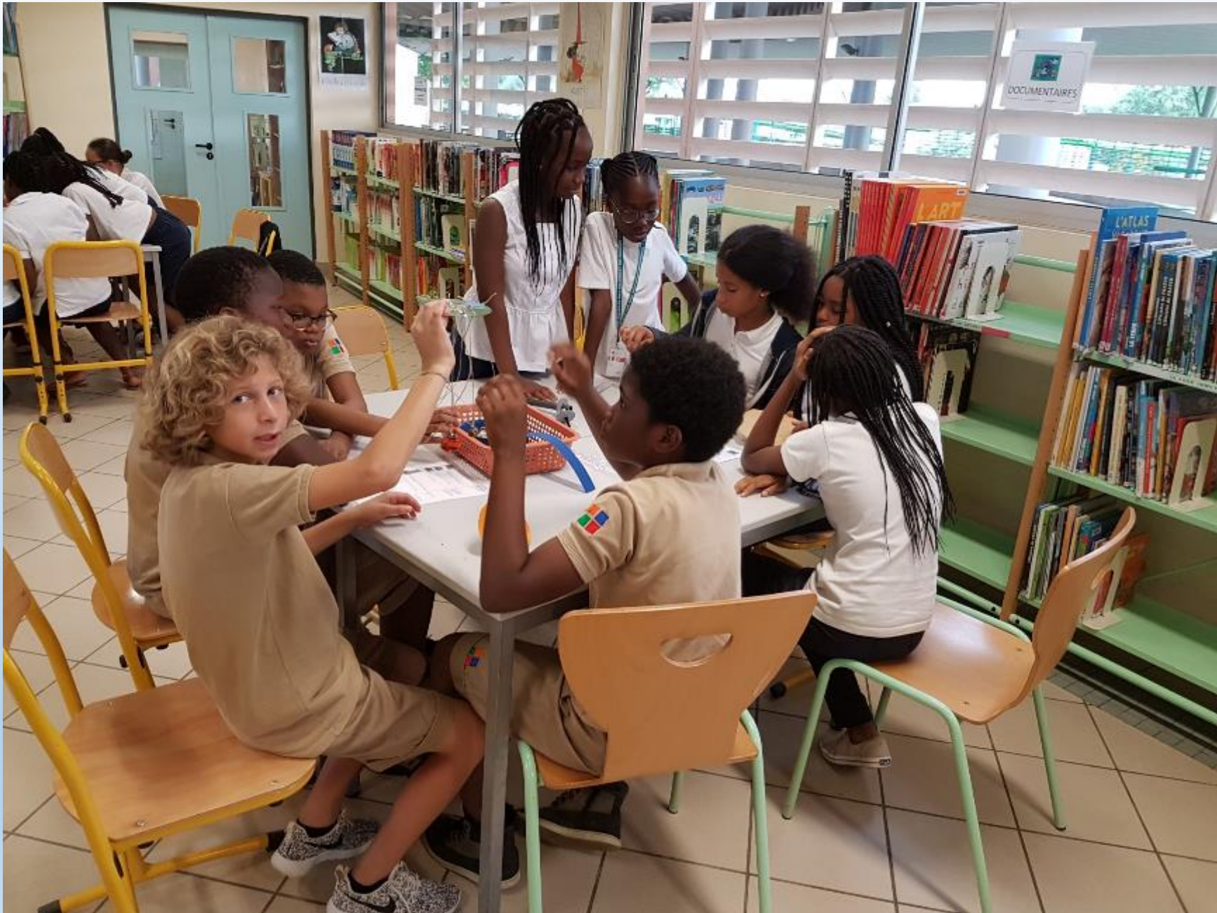
VISITE DES ELEVES DE 6 ème AUX ELEVES DE CM2 POUR LE MONTAGE DES CARROUSELS