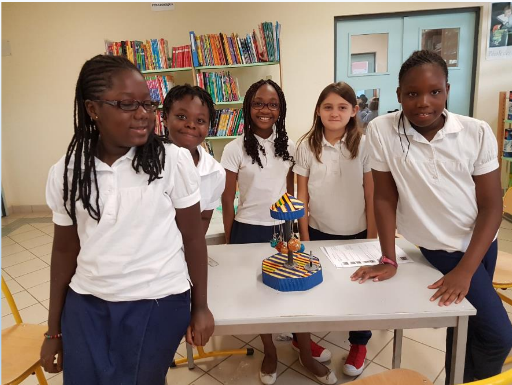
VISITE DES ELEVES DE 6 ème AUX ELEVES DE CM2 POUR LE MONTAGE DES CARROUSELS