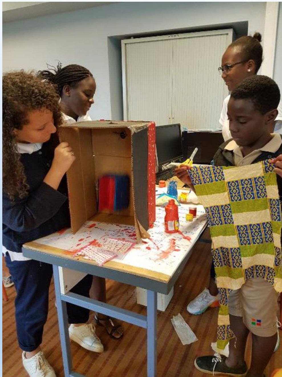
VISITE DES ELEVES DE CM2 AUX ELEVES DE 6 ème POUR LA DECORATION DE LEURS REALISATIONS