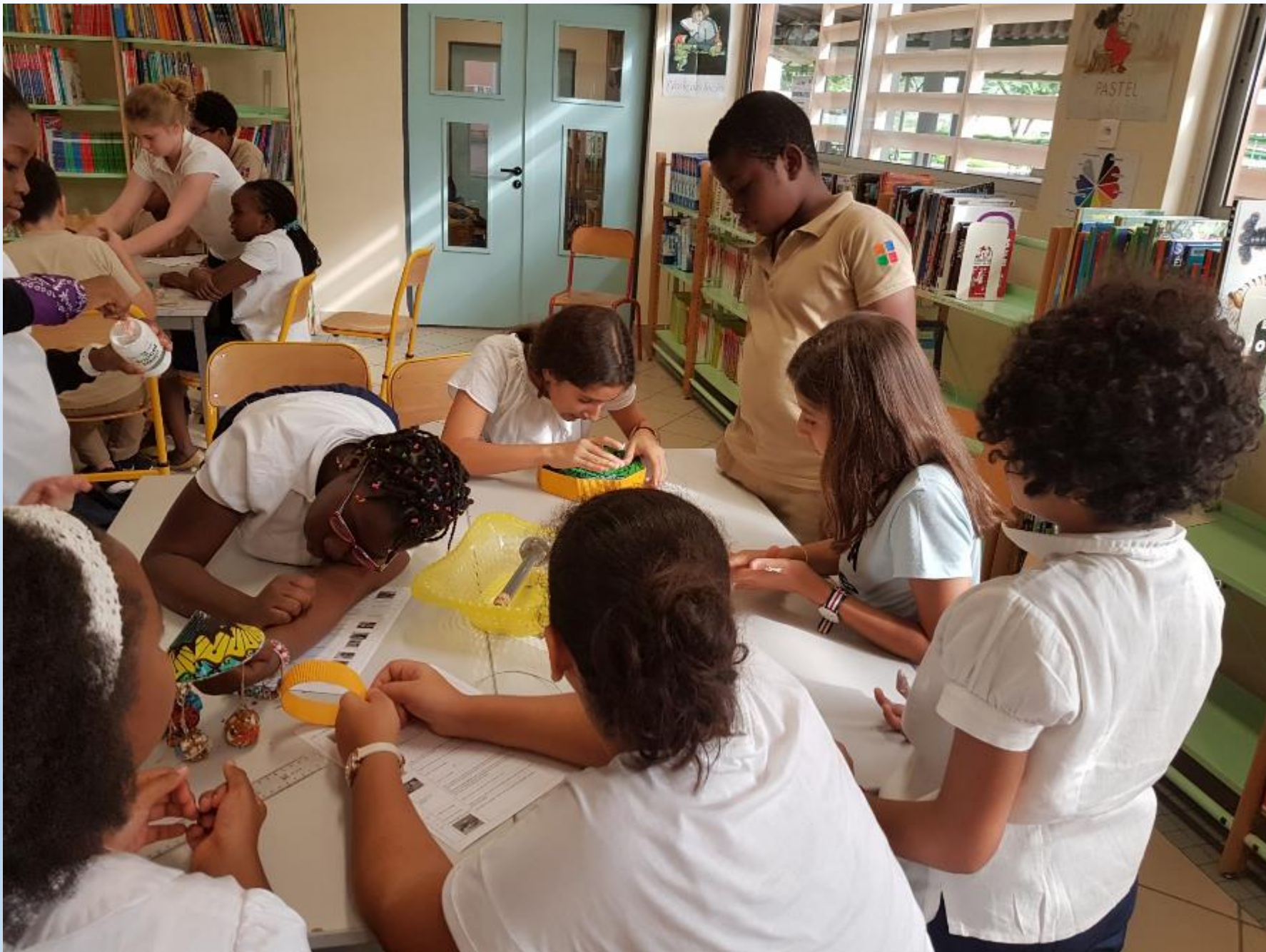
VISITE DES ELEVES DE 6 ème AUX ELEVES DE CM2 POUR LE MONTAGE DES CARROUSELS