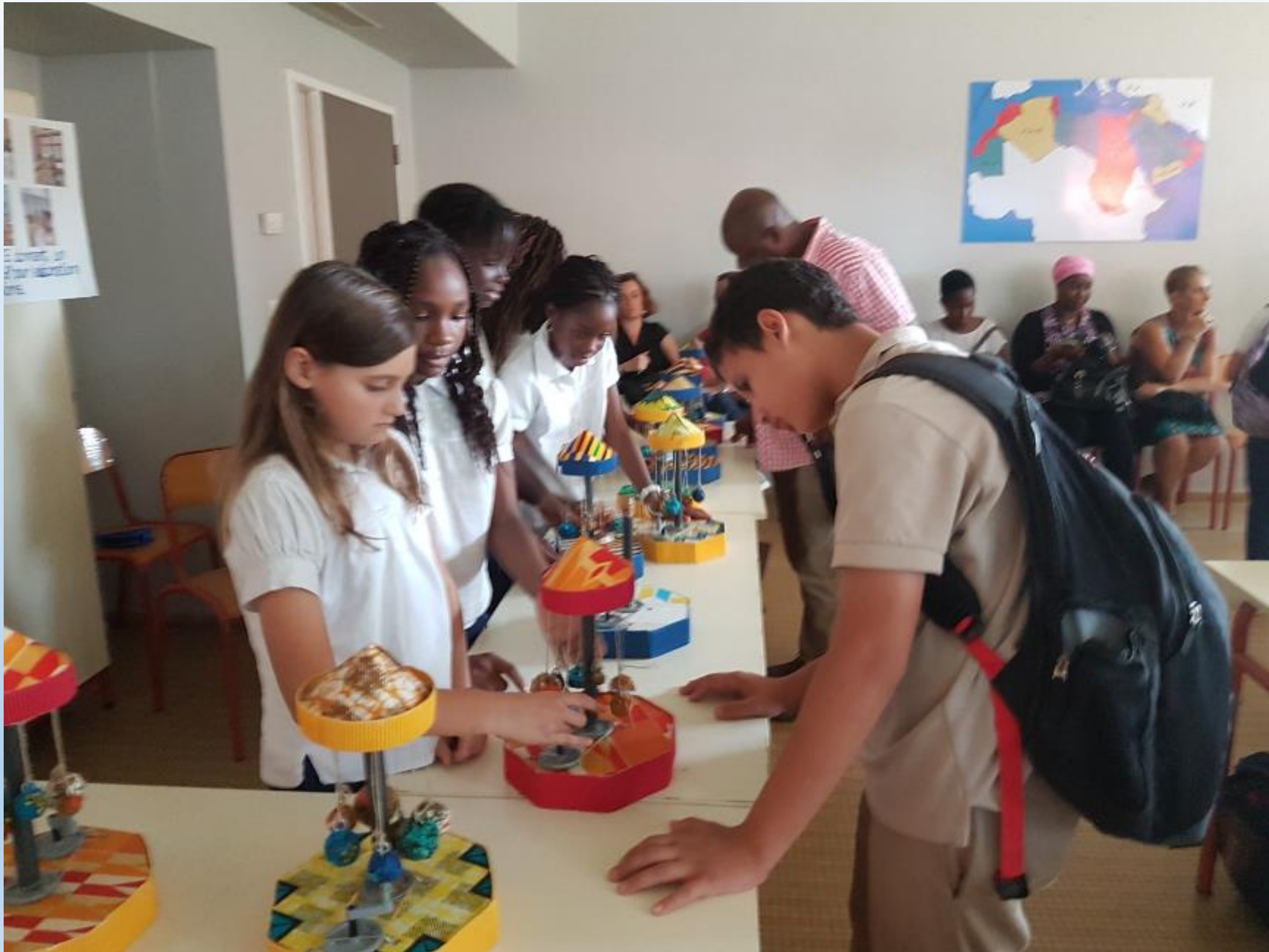
EXPOSITION DE NOS CARROUSSELS LE 31 MARS A LA JOURNEE DES SCIENCES AU LYCEE FRANCAIS BLAISE PASCAL