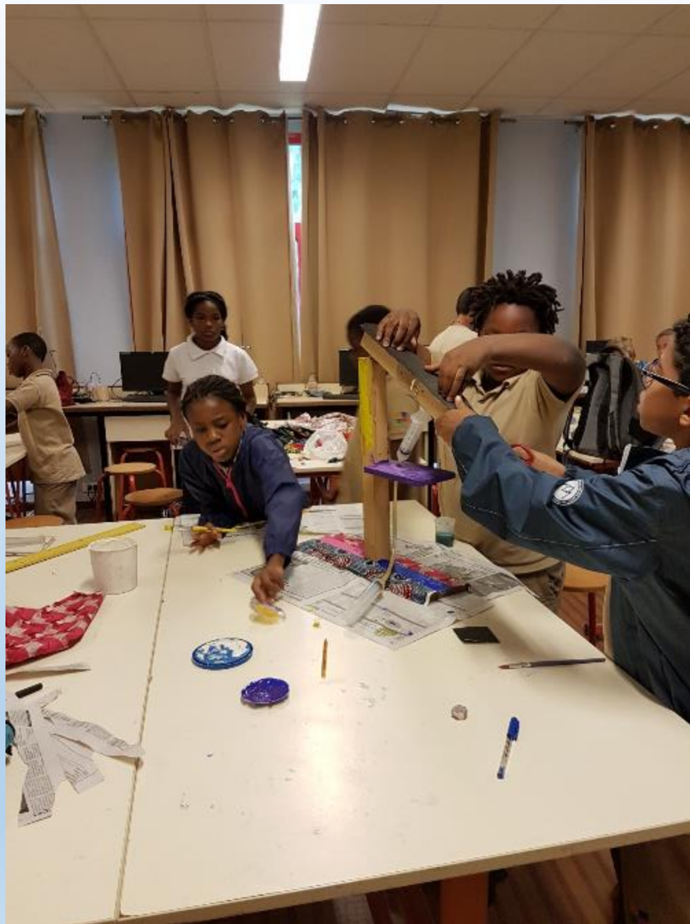
VISITE DES ELEVES DE CM2 AUX ELEVES DE 6 ème POUR LA DECORATION DE LEURS REALISATIONS