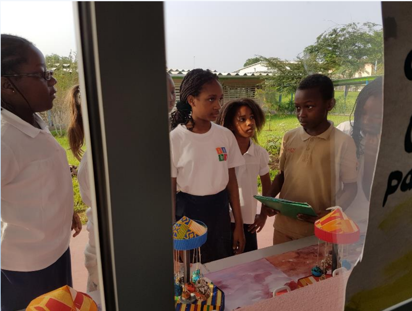
EXPOSITION A LA SEMAINE DE LA SCIENCE A L'ECOLE JAQUES PREVERT