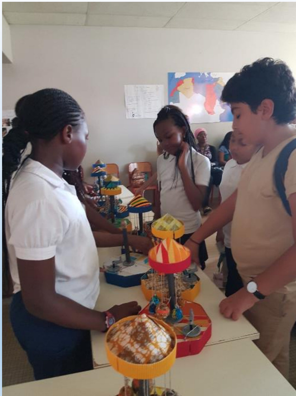
EXPOSITION DE NOS CARROUSSELS LE 31 MARS A LA JOURNEE DES SCIENCES AU LYCEE FRANCAIS BLAISE PASCAL