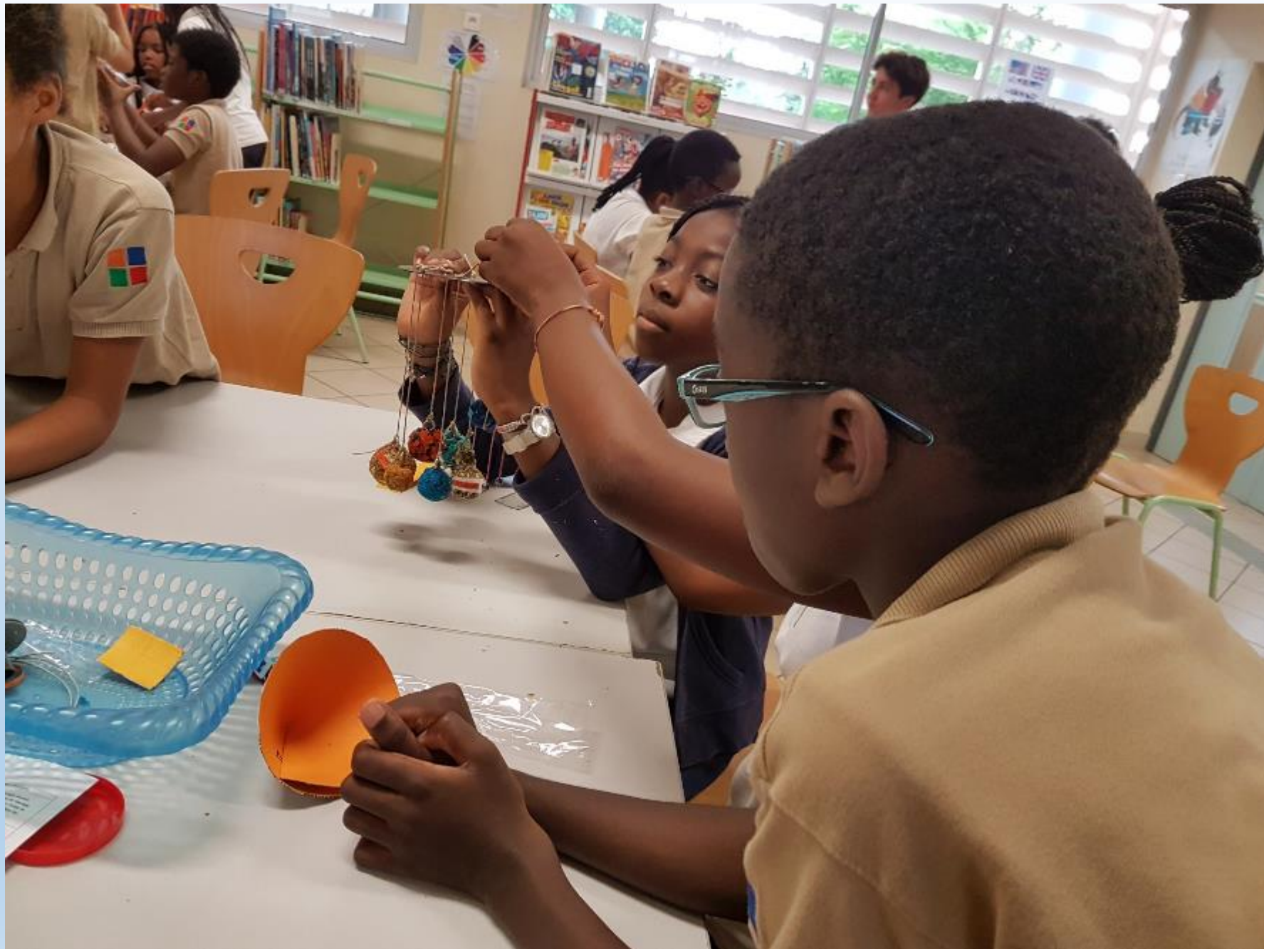
VISITE DES ELEVES DE 6 ème AUX ELEVES DE CM2 POUR LE MONTAGE DES CARROUSELS