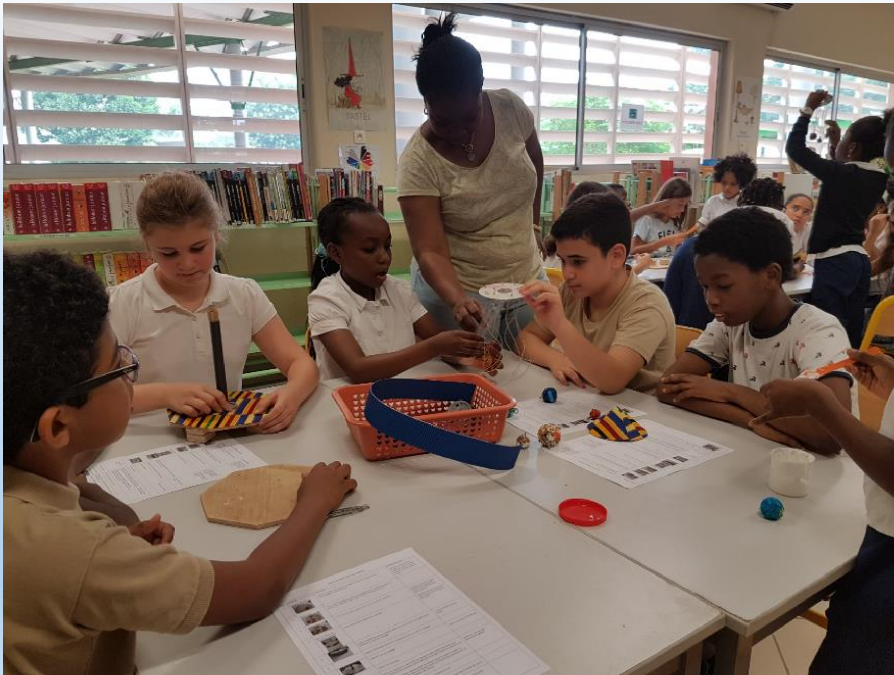
VISITE DES ELEVES DE 6 ème AUX ELEVES DE CM2 POUR LE MONTAGE DES CARROUSELS