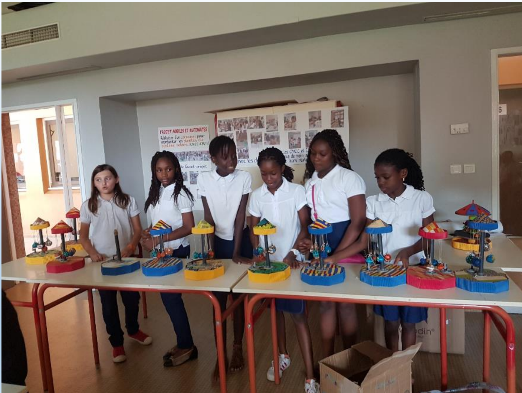
EXPOSITION DE NOS CARROUSSELS LE 31 MARS A LA JOURNEE DES SCIENCES AU LYCEE FRANCAIS BLAISE PASCAL