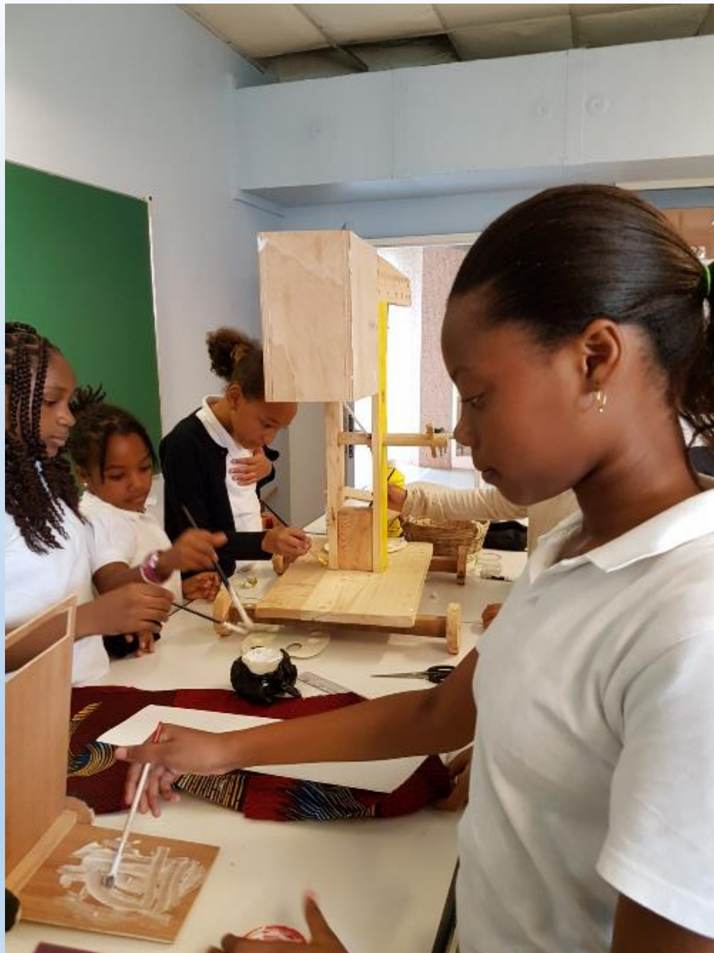
VISITE DES ELEVES DE CM2 AUX ELEVES DE 6 ème POUR LA DECORATION DE LEURS REALISATIONS