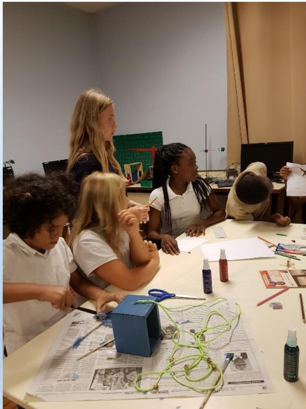
VISITE DES ELEVES DE CM2 AUX ELEVES DE 6 ème POUR LA DECORATION DE LEURS REALISATIONS