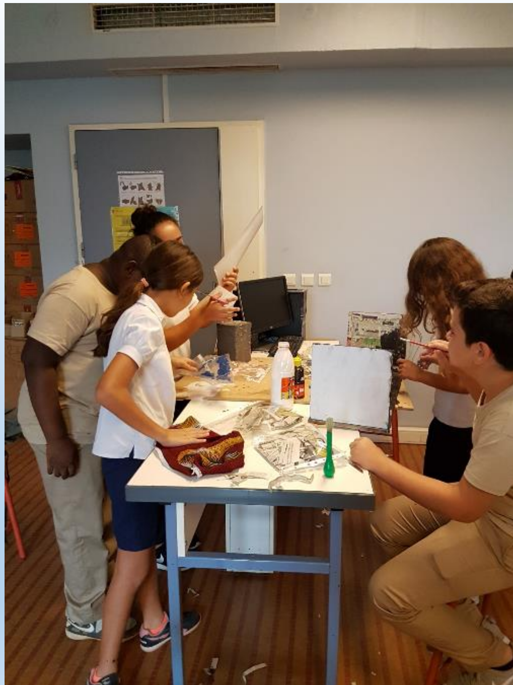
VISITE DES ELEVES DE CM2 AUX ELEVES DE 6 ème POUR LA DECORATION DE LEURS REALISATIONS