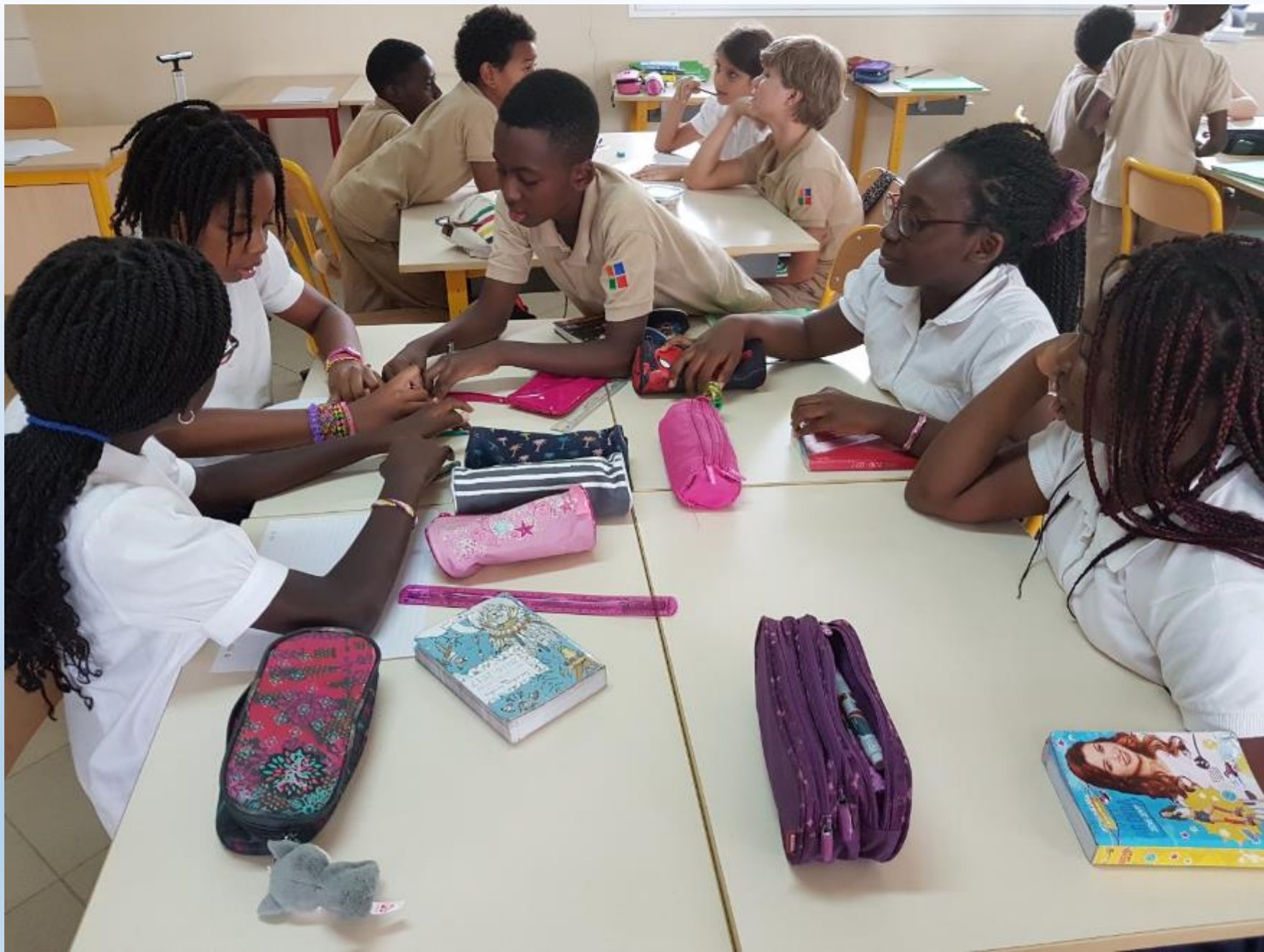
REDACTION AVANT PROJET