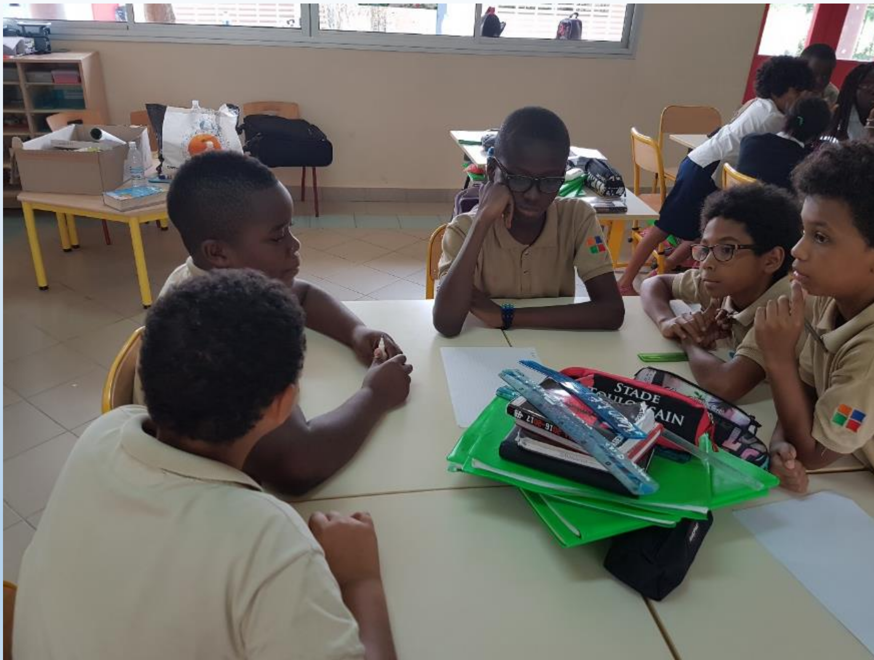
REDACTION AVANT PROJET