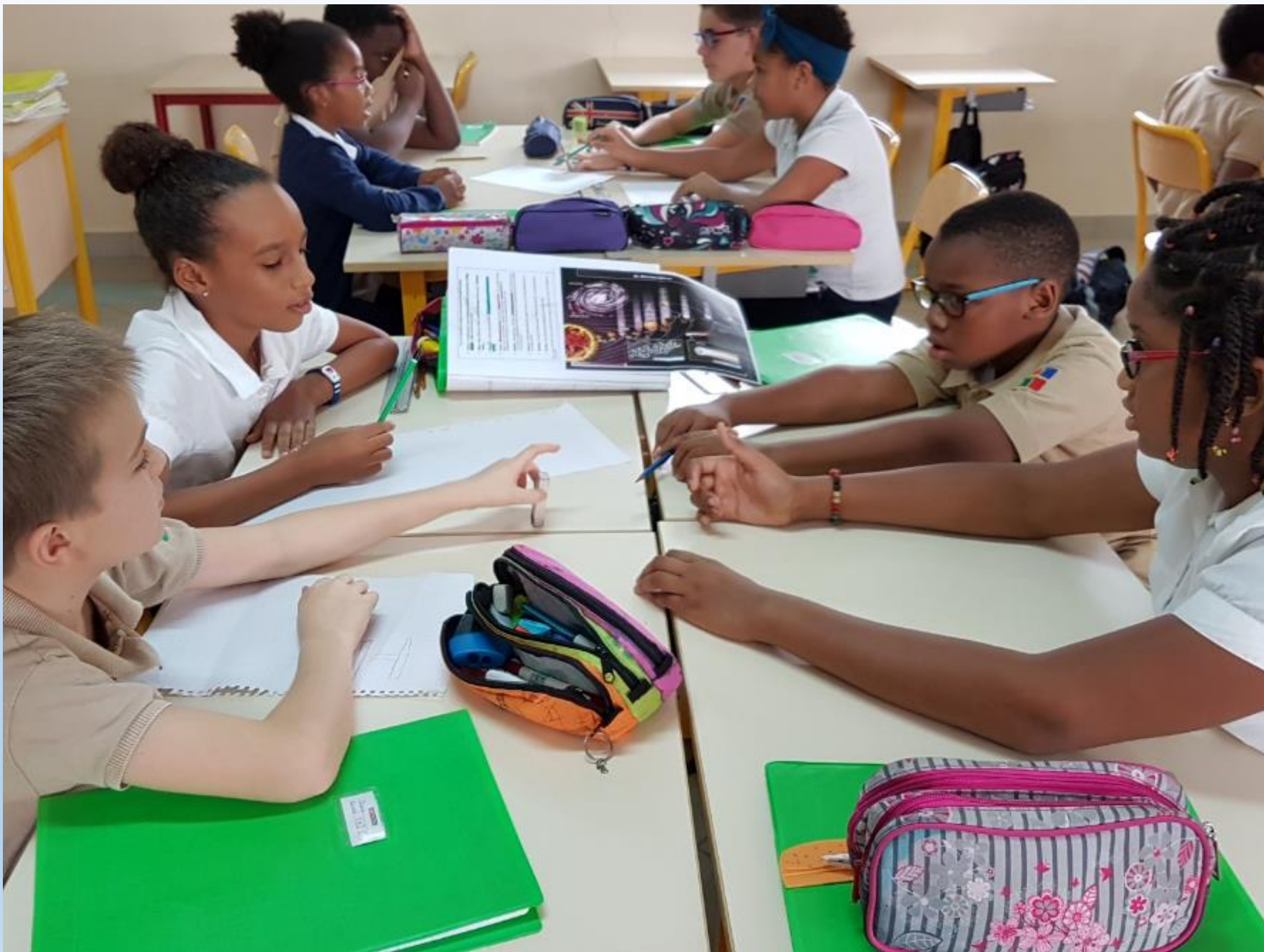
REDACTION AVANT PROJET