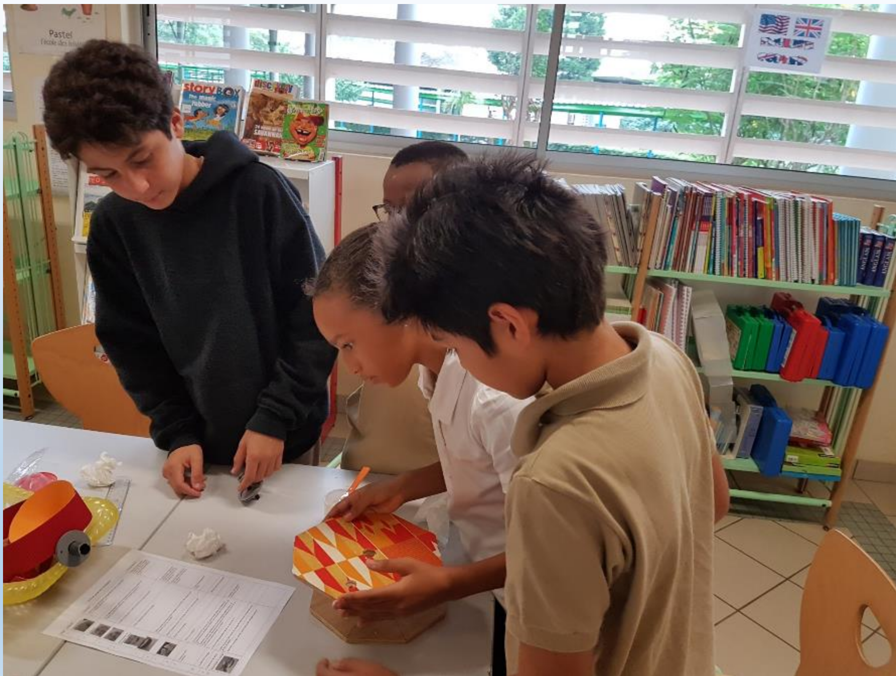
VISITE DES ELEVES DE 6 ème AUX ELEVES DE CM2 POUR LE MONTAGE DES CARROUSELS