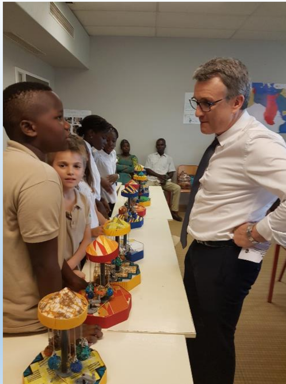
VISITE DU PROVISEUR A LA JOURNEE DES SCIENCES AU LYCEE FRANCAIS BLAISE PASCAL