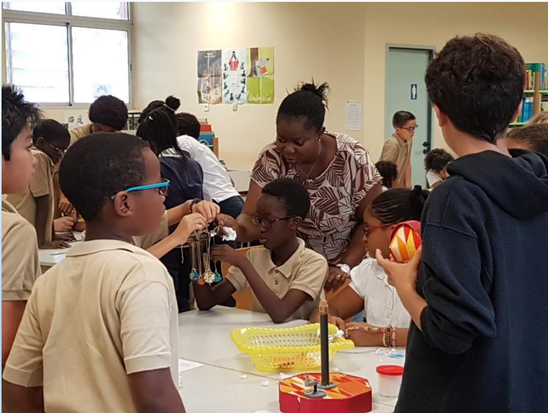
VISITE DES ELEVES DE 6 ème AUX ELEVES DE CM2 POUR LE MONTAGE DES CARROUSELS