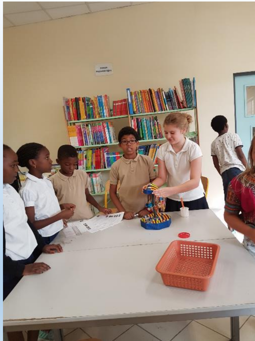
VISITE DES ELEVES DE 6 ème AUX ELEVES DE CM2 POUR LE MONTAGE DES CARROUSELS