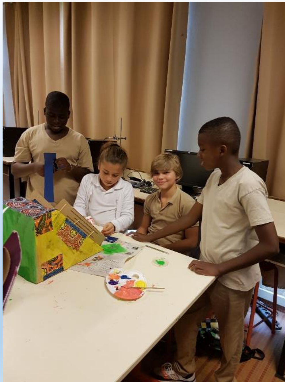
VISITE DES ELEVES DE CM2 AUX ELEVES DE 6 ème POUR LA DECORATION DE LEURS REALISATIONS