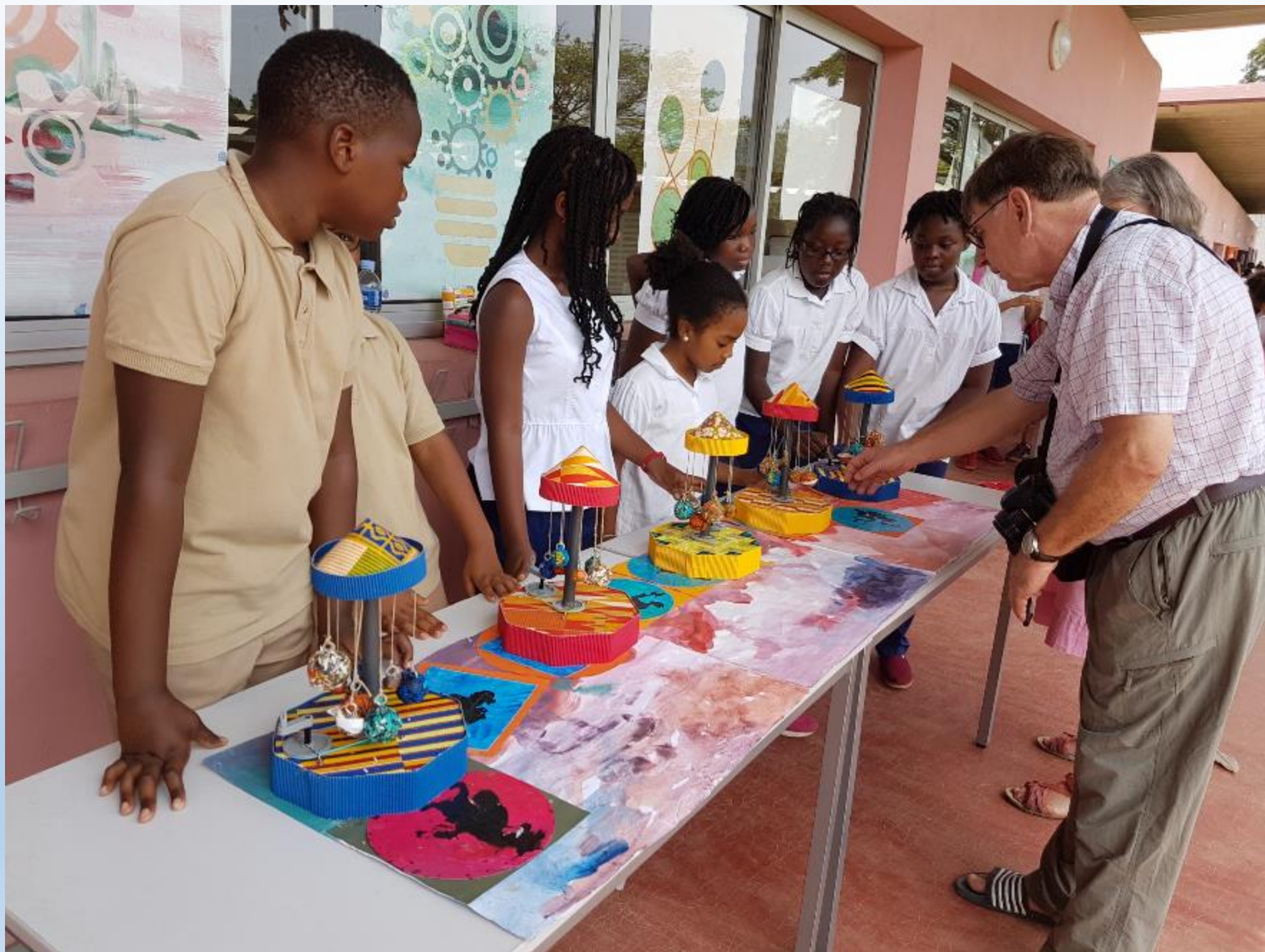
EXPOSITION A LA SEMAINE DE LA SCIENCE A L'ECOLE JACQUES PREVERT