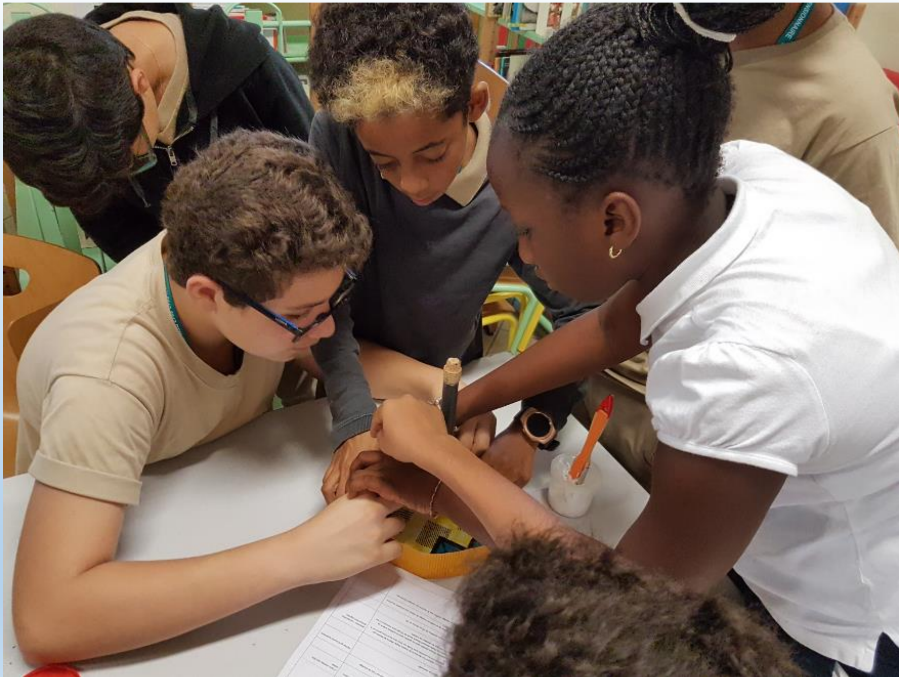
VISITE DES ELEVES DE 6 ème AUX ELEVES DE CM2 POUR LE MONTAGE DES CARROUSELS