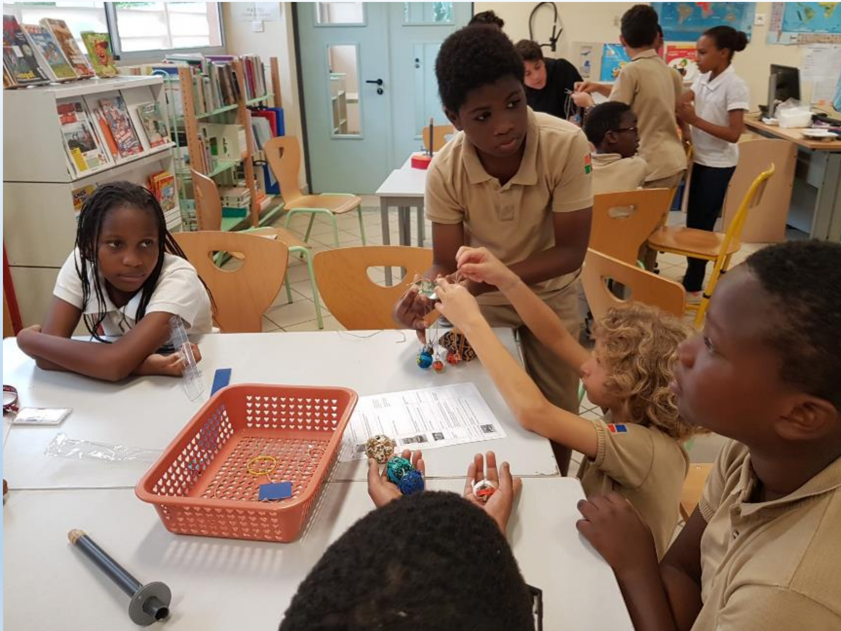
VISITE DES ELEVES DE 6 ème AUX ELEVES DE CM2 POUR LE MONTAGE DES CARROUSELS