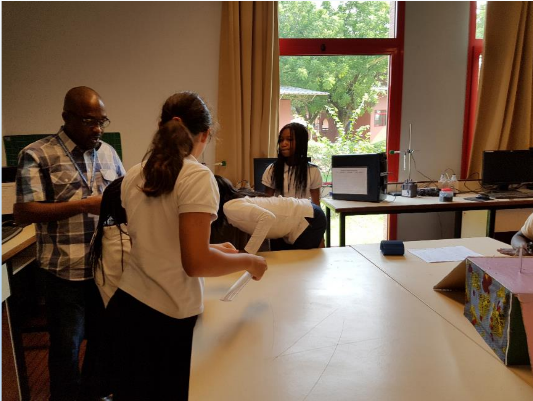
VISITE DES ELEVES DE CM2 AUX ELEVES DE 6 ème POUR LA DECORATION DE LEURS REALISATIONS