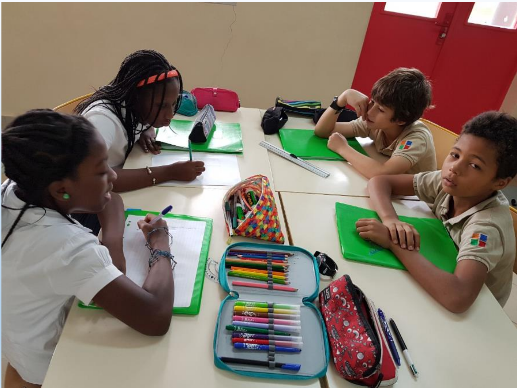
REDACTION AVANT PROJET