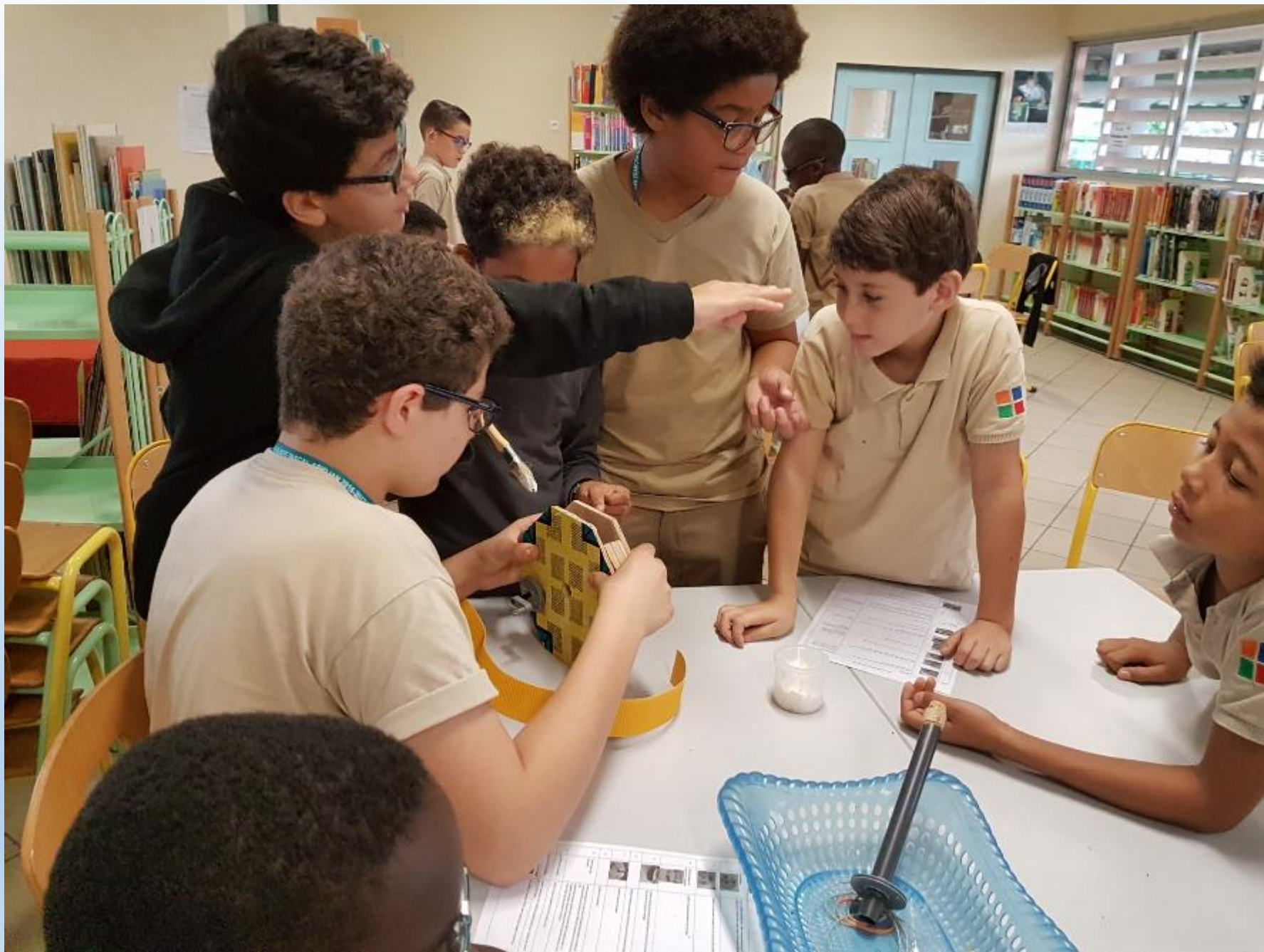
VISITE DES ELEVES DE 6 ème AUX ELEVES DE CM2 POUR LE MONTAGE DES CARROUSELS