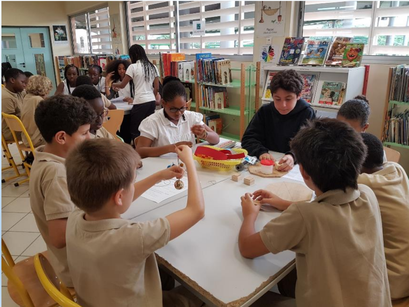
VISITE DES ELEVES DE 6 ème AUX ELEVES DE CM2 POUR LE MONTAGE DES CARROUSELS