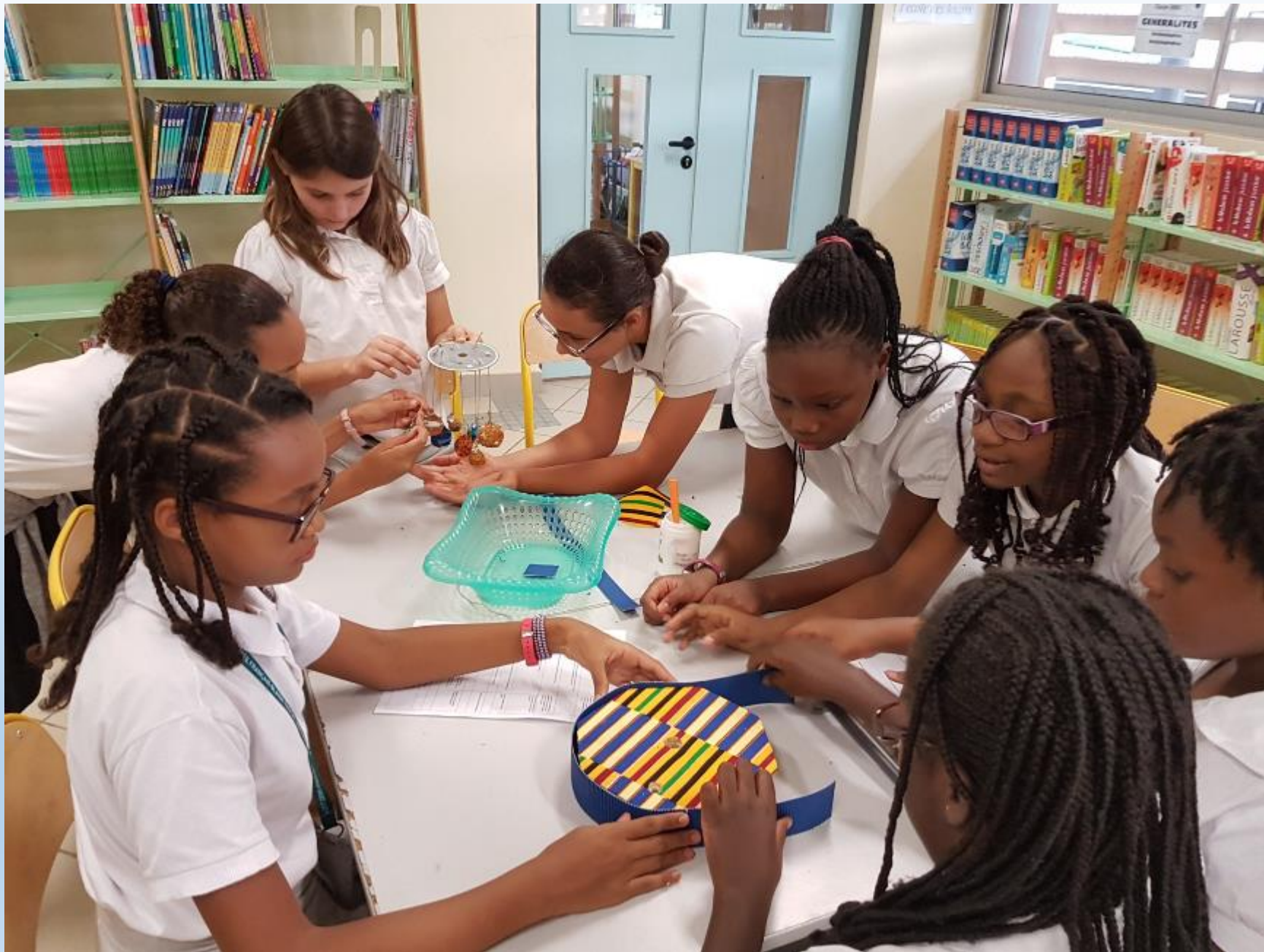
VISITE DES ELEVES DE 6 ème AUX ELEVES DE CM2 POUR LE MONTAGE DES CARROUSELS