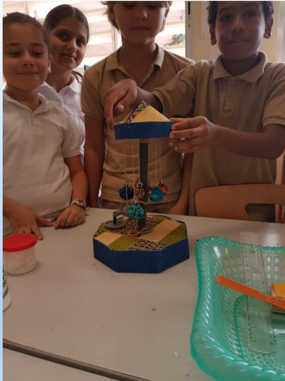
VISITE DES ELEVES DE 6 ème AUX ELEVES DE CM2 POUR LE MONTAGE DES CARROUSELS