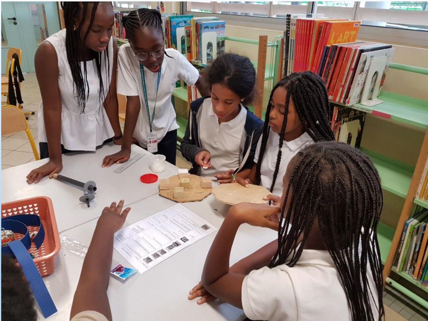
VISITE DES ELEVES DE 6 ème AUX ELEVES DE CM2 POUR LE MONTAGE DES CARROUSELS