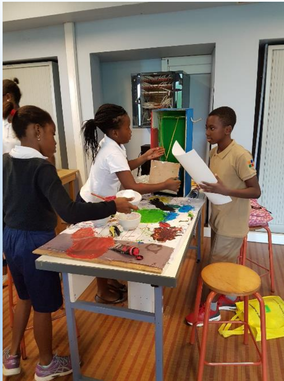
VISITE DES ELEVES DE CM2 AUX ELEVES DE 6 ème POUR LA DECORATION DE LEURS REALISATIONS