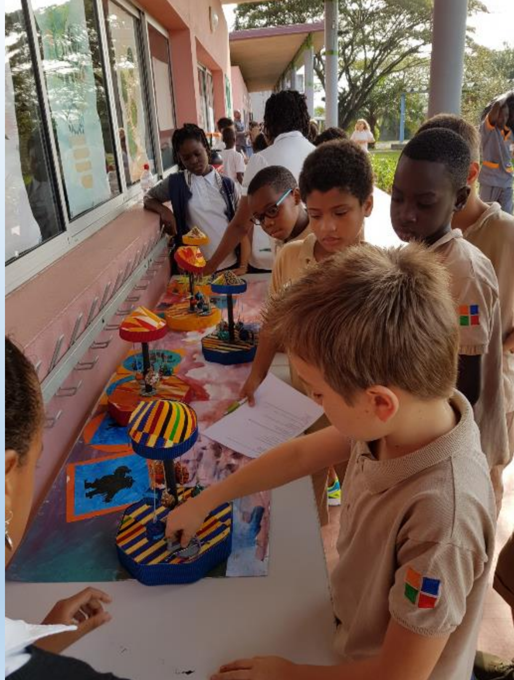
EXPOSITION A LA SEMAINE DE LA SCIENCE A L'ECOLE JACQUES PREVERT