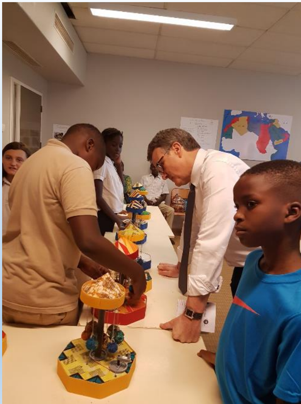
LES ELEVES PRESENTENT LEUR TRAVAIL AU PROVISEUR DU LYCEE FRANCAIS BLAISE PASCAL