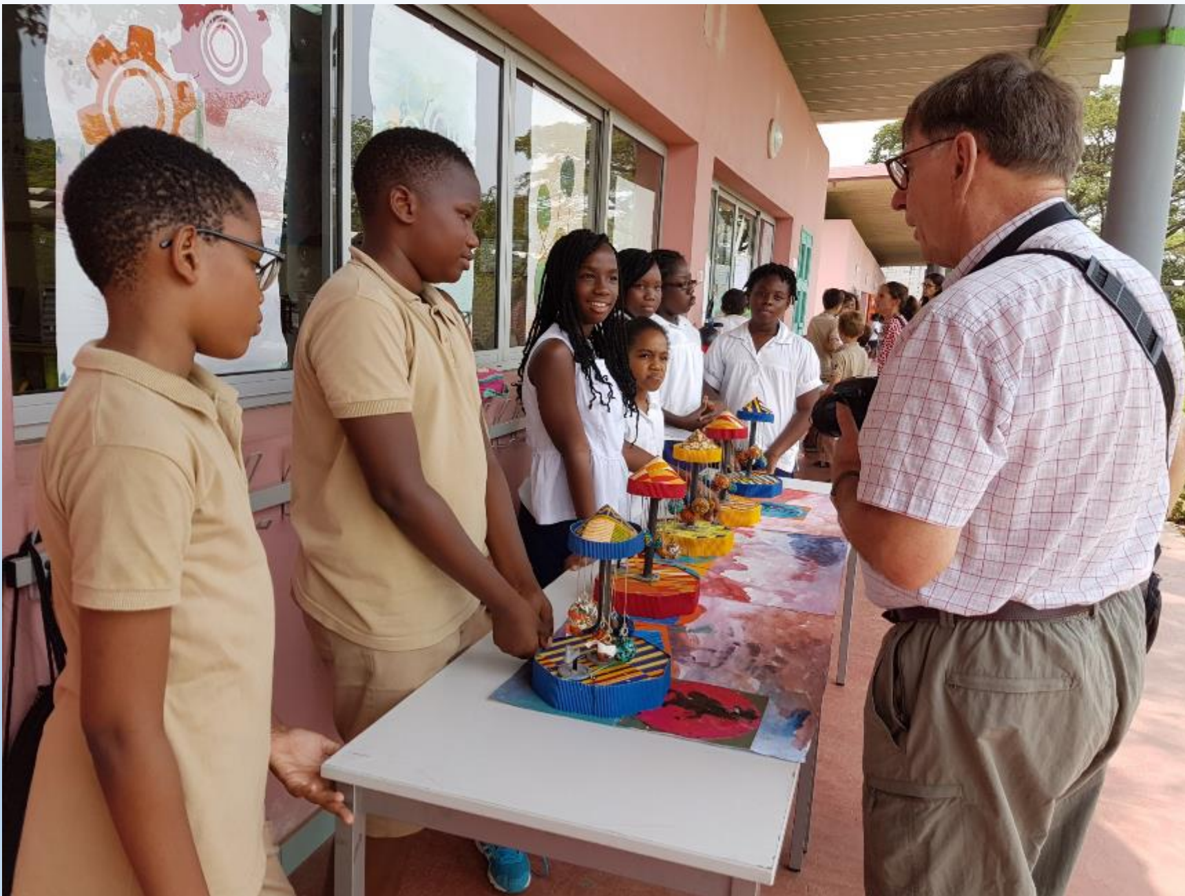
EXPOSITION A LA SEMAINE DE LA SCIENCE A L'ECOLE JACQUES PREVERT